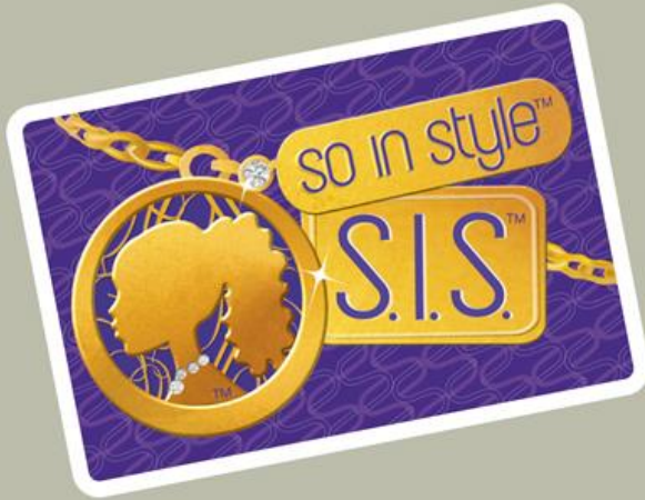
Naomi Barbie So In Style Kara